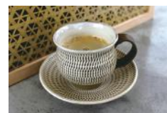
小鹿田燒 陶器杯子和杯子托碟 (咖啡杯子製品)

商店內有豐富多彩的與衣·食·住等相關的各式各樣的竹製品。還設有咖啡的櫃檯，可以一邊眺望竹林一邊慢慢的休息。